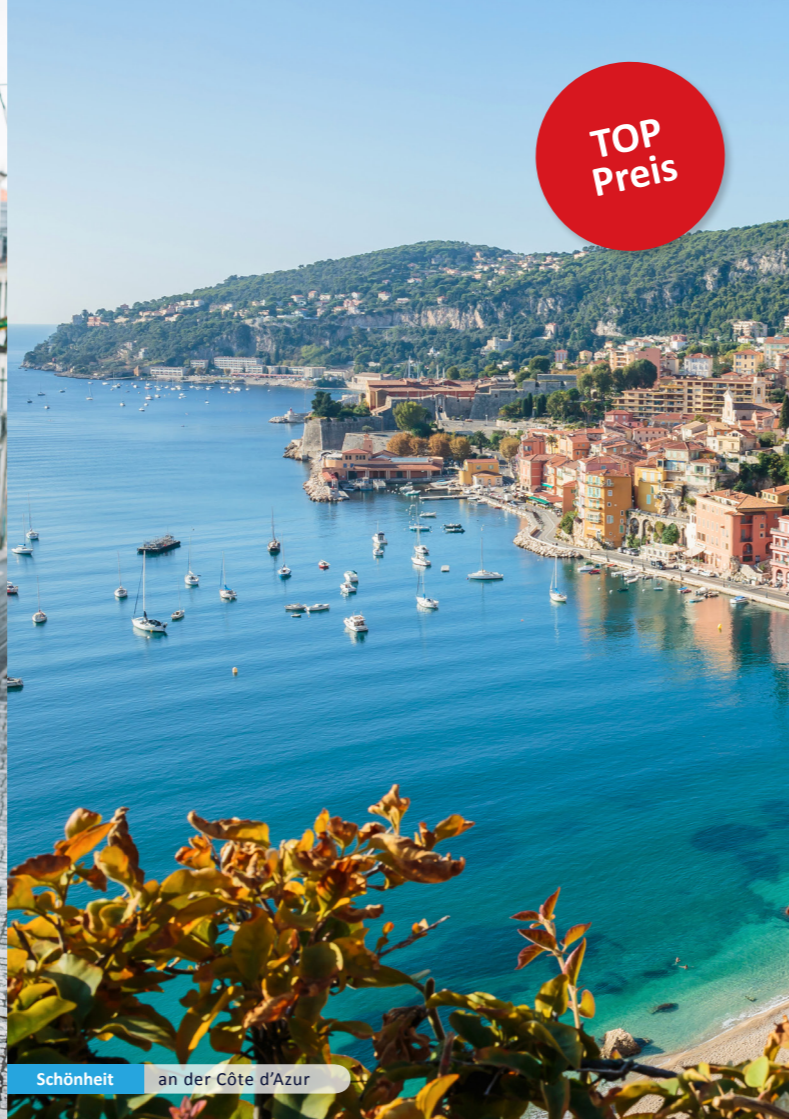
Schönheit an der Côte d'Azur