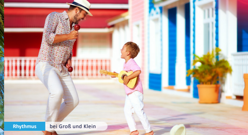
Rhythmus bei Groß und Klein

Deutschsprachiger Ausflug in die Everglades inklusive!