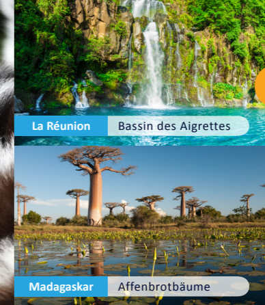
La Réunion Bassin des Aigrettes