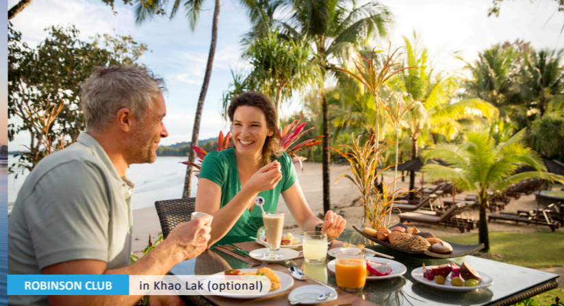
ROBINSON CLUB in Khao Lak (optional)

Tipp: Verlängerung ROBINSON CLUB KHAO LAK buchen