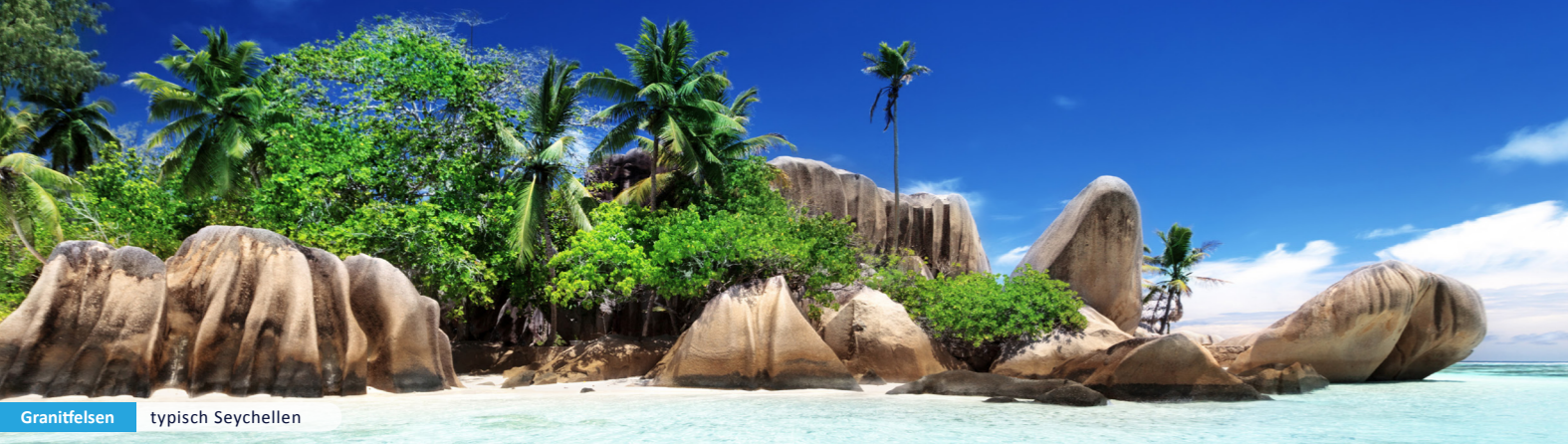
Granitfelsen typisch Seychellen