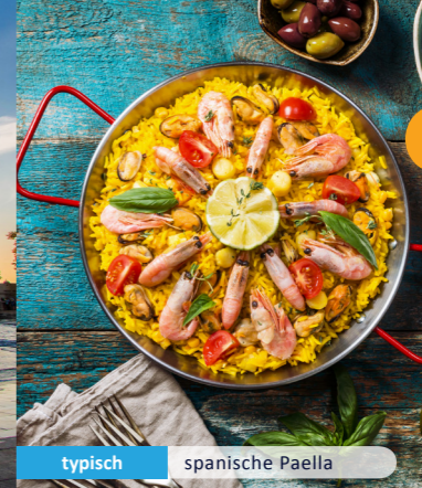
typisch spanische Paella

11 Tage 10.11.2019 – 20.11.2019 20.11.2019 – 30.11.2019 5 weitere Termine online verfügbar