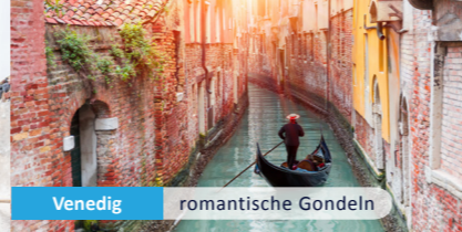
Venedig romantische Gondeln