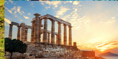
Athen der Poseidontempel