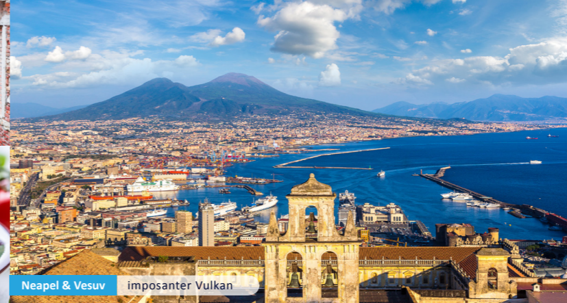
Neapel & Vesuvius imposanter Vulkan