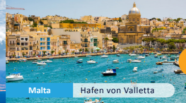
Malta Hafen von Valletta