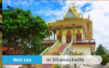
Wat Leu in Sihanouville