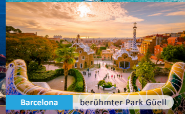
Barcelona berühmter Park Güell

Erleben Sie Pompeji, die versunkene Stadt