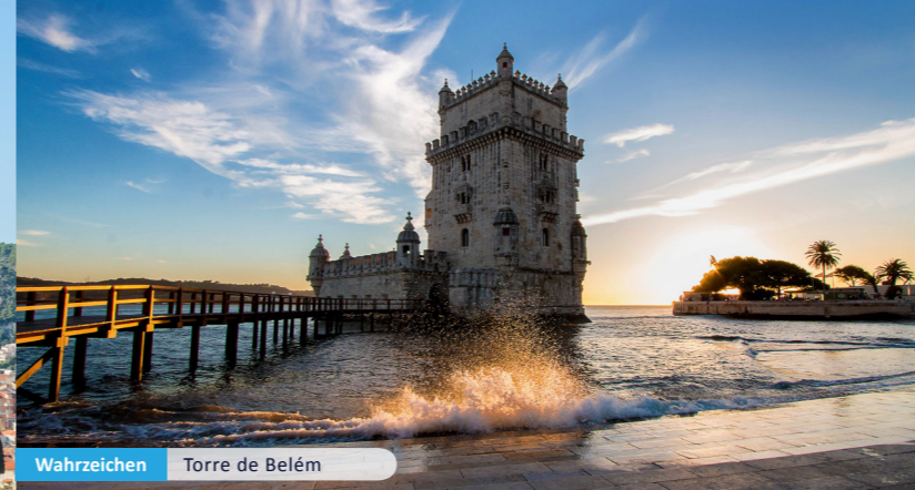
Wahrzeichen Torre de Belém