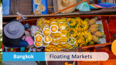
Bangkok Floating Markets