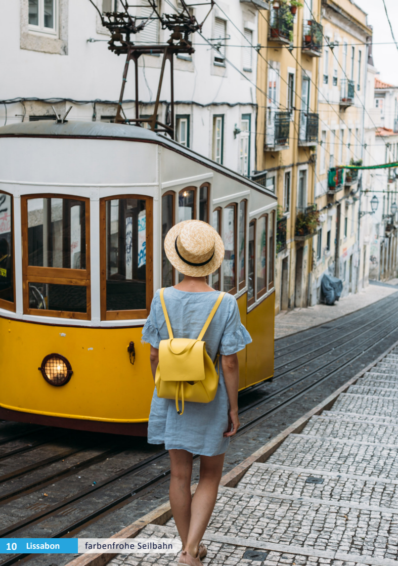
10 Lissabon farbenfrohe Seilbahn