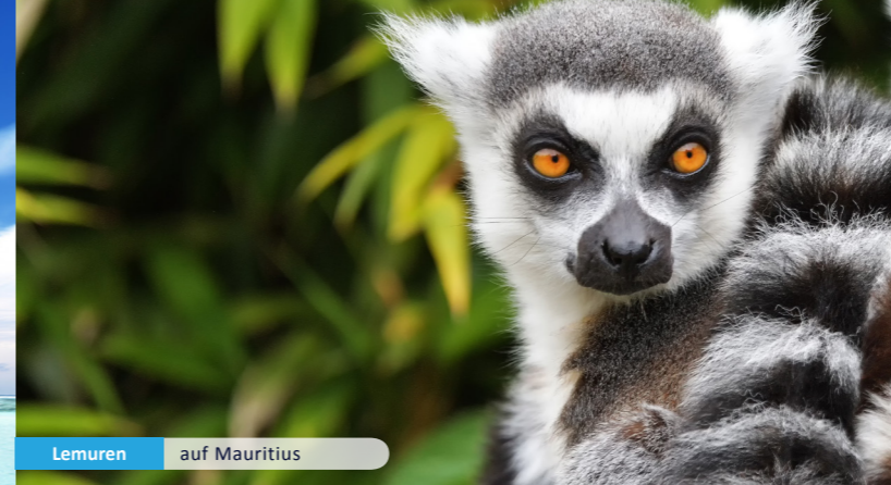
Lemuren auf Mauritius